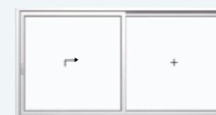
Schema A, DIN links 1 Hebe-Schiebeflügel, 1 Festverglasung