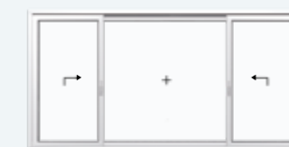
Schema K 2 Hebe-Schiebeflügel, 1 Festverglasung