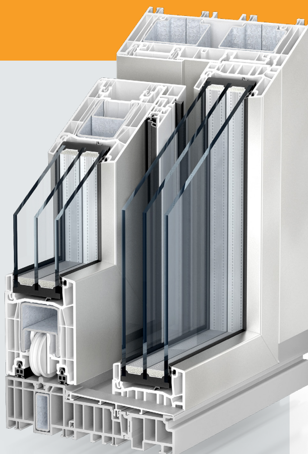
PremiDoor 76 LUX